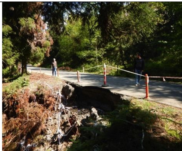
Road Km 62+730