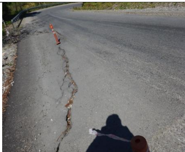
Road Km 60+120