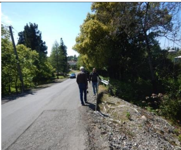
Road km 61+950