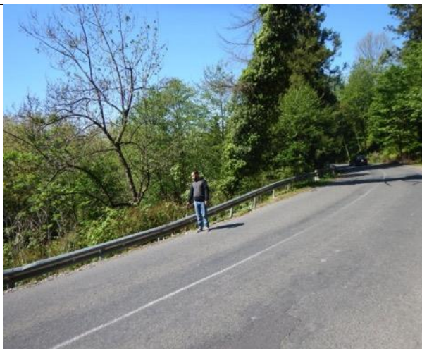
Road km 63+615